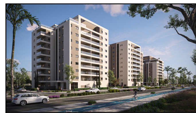
ההדמיה להתרשמות בלבד ואינה מחייבת את החברה

* ראה רשימת הערות כללית מצורפת לתכנית אלו. ** ראה רשימת הערות ומקרא בתחילת קובץ תכניות המכר