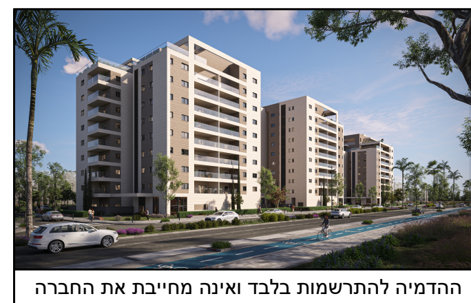
ההדמיה להתרשמות בלבד ואינה מחייבת את החברה

* ראה רשימת הערות כללית מצורפת לתכנית אלו. ** ראה רשימת הערות ומקרא בתחילת קובץ תכניות המכר